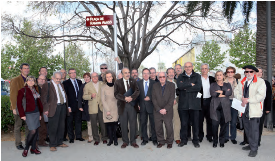
Els membres de la Secció Filològica en la inauguració de la placa viària de la plaça de Ramon Amigó (Mas Iglesias), el 21 d'abril.